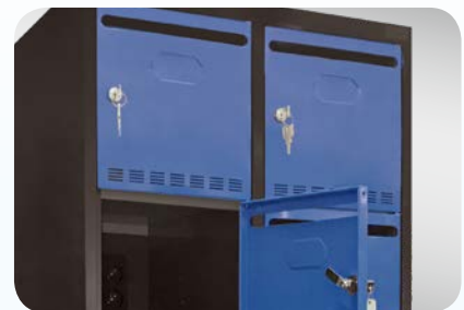
Flügeltüren mit Briefdurchwurf und Beschriftungsmöglichkeit, aus Vollblech