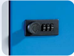
manuelles Zahlenschloss (auf Anfrage)