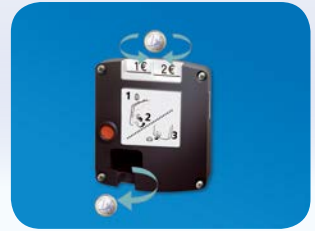
Münzpfandschloss (auf Anfrage)