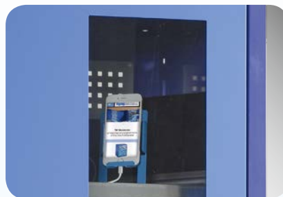
Flügeltüren mit Sichtfenster