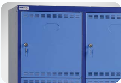
Flügeltüren mit Beschriftungsmöglichkeit aus Vollblech (Standard)