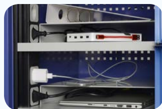
Optional ist auch ein zusätzlicher Fachboden lieferbar