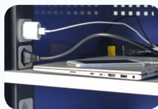
Ausführung: 2 Steckdosen pro Fach