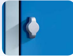
Für Vorhängeschloss (auf Anfrage)